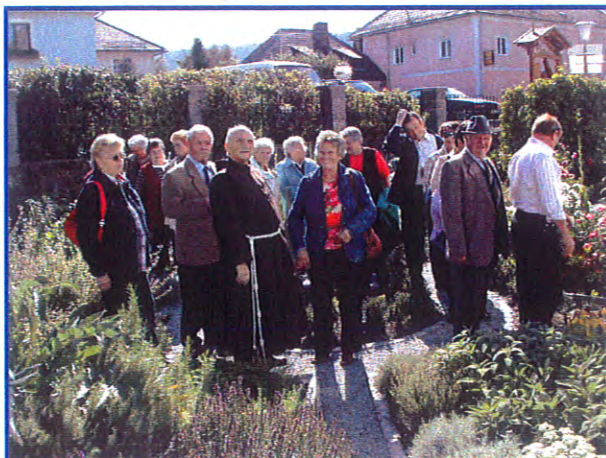
Sandl in OÖ