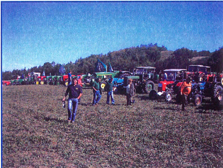
Oldtimer Club Pottenhofen