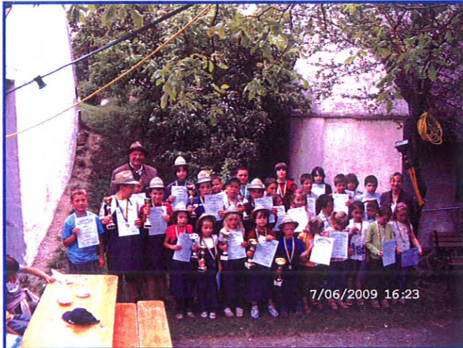
Kellerknirps Rallye (Galgenbergfest)