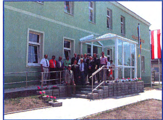
Zu- und Umbau Volksschule Wildendürnbach