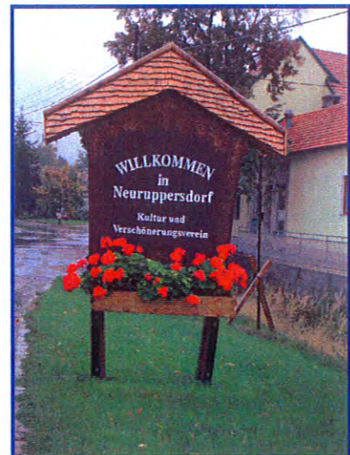
Schönstes Dorf im Weinviertel