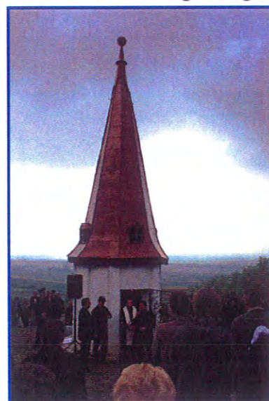
Einsegnung des neugestalteten Turmes am Galgenberg