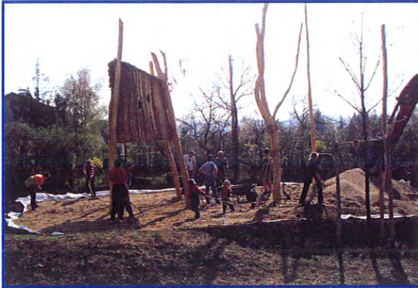
Neuer Spielplatz in Wildendürnbach