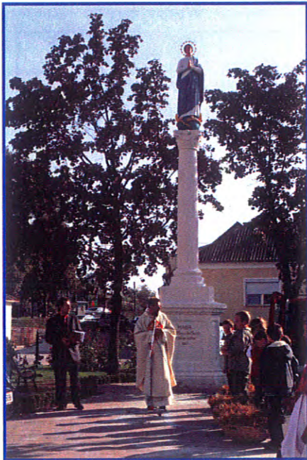
Erntedank in Wildendürnbach Neugestaltung der Mariensäule